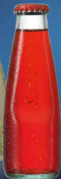
San Bitter 4 x 6 x 0,098 l Art.-Nr. 64111