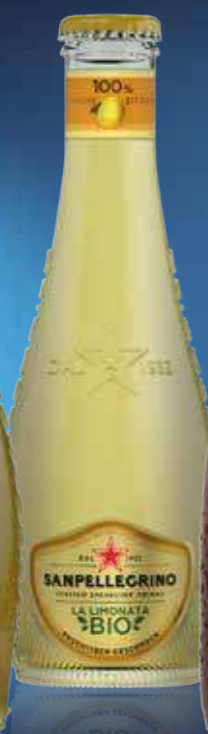
San Pellegrino La Limonata Bio 20 x 0,275 l Art.-Nr. 41113