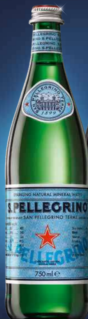
San Pellegrino 12 x 0,75 l Art.-Nr. 41118