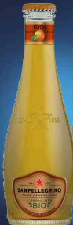
San Pellegrino L'Aranciata Bio 20 x 0,275 l Art.-Nr. 41114

DEINE PARTNER FÜR ALLE GENUSSVOLLEN MOMENTE.