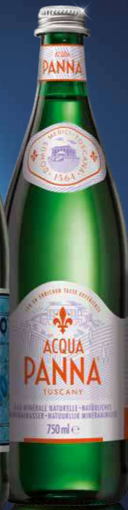
Acqua Panna 12 x 0,75 l Art.-Nr. 42116