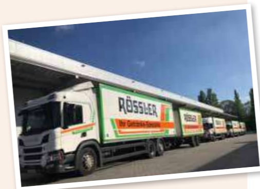
Herzlichst, Ihr gesamtes Getränke Rössler Team

Haben Sie bereits unser neues Online-Portal entdeckt? Wenn nicht: Registrieren Sie sich am besten gleich unter www.gastro-aktuell-plus.de oder scannen Sie den Code. Neben weiterführenden gastro-spezifischen Tipps können Sie dort auch alle Aktionen wie in einem Shop direkt bestellen . In diesem Sinne wünschen wir Ihnen eine beste Aufstellung und meisterliche Geschäfte.